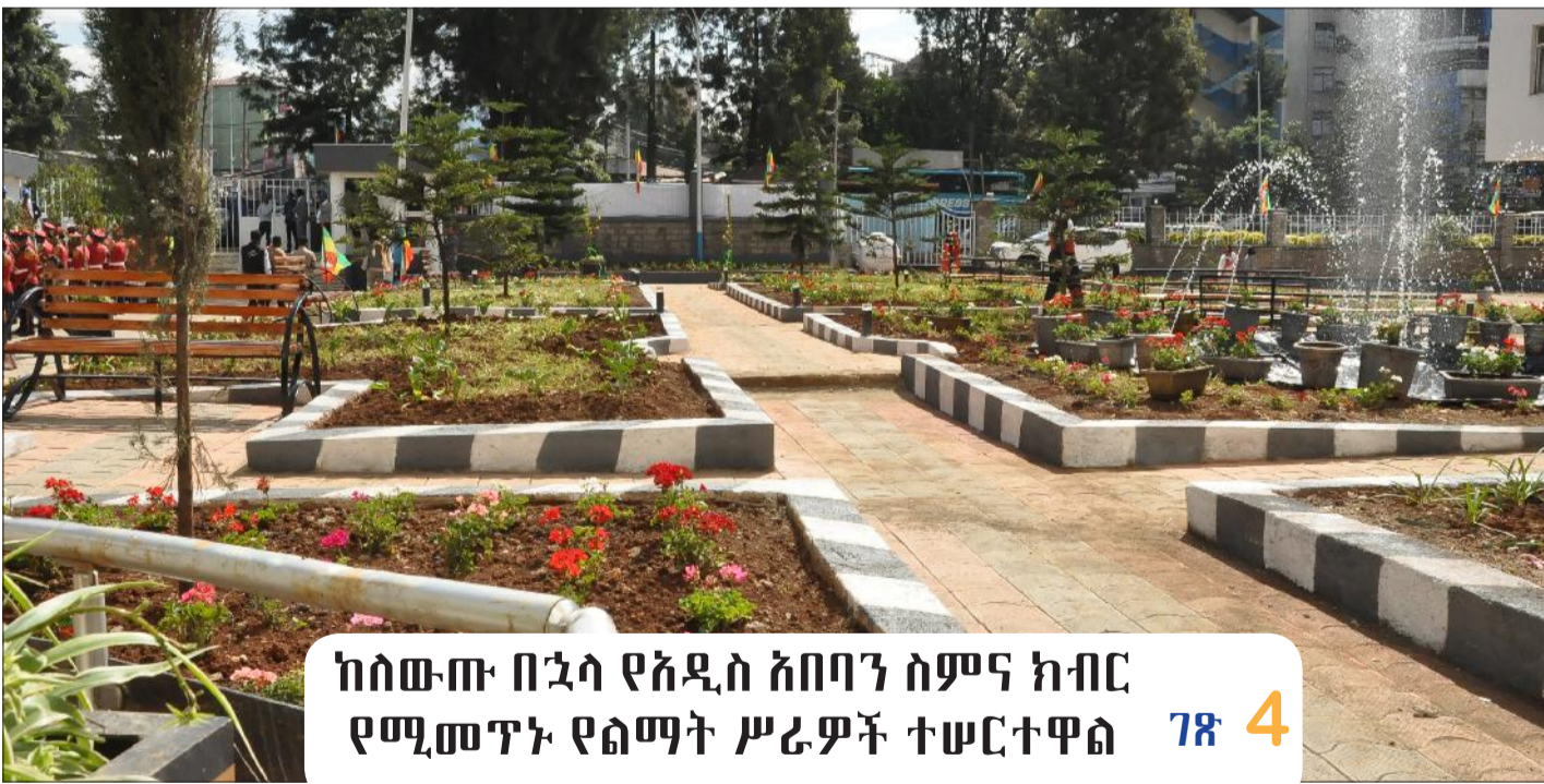
ከሰውጡ በኋላ የአዲስ አበባን ስምና ክብር የሚመጥኑ የልማት ስራዎች ተሠርተዋል ገጽ 4