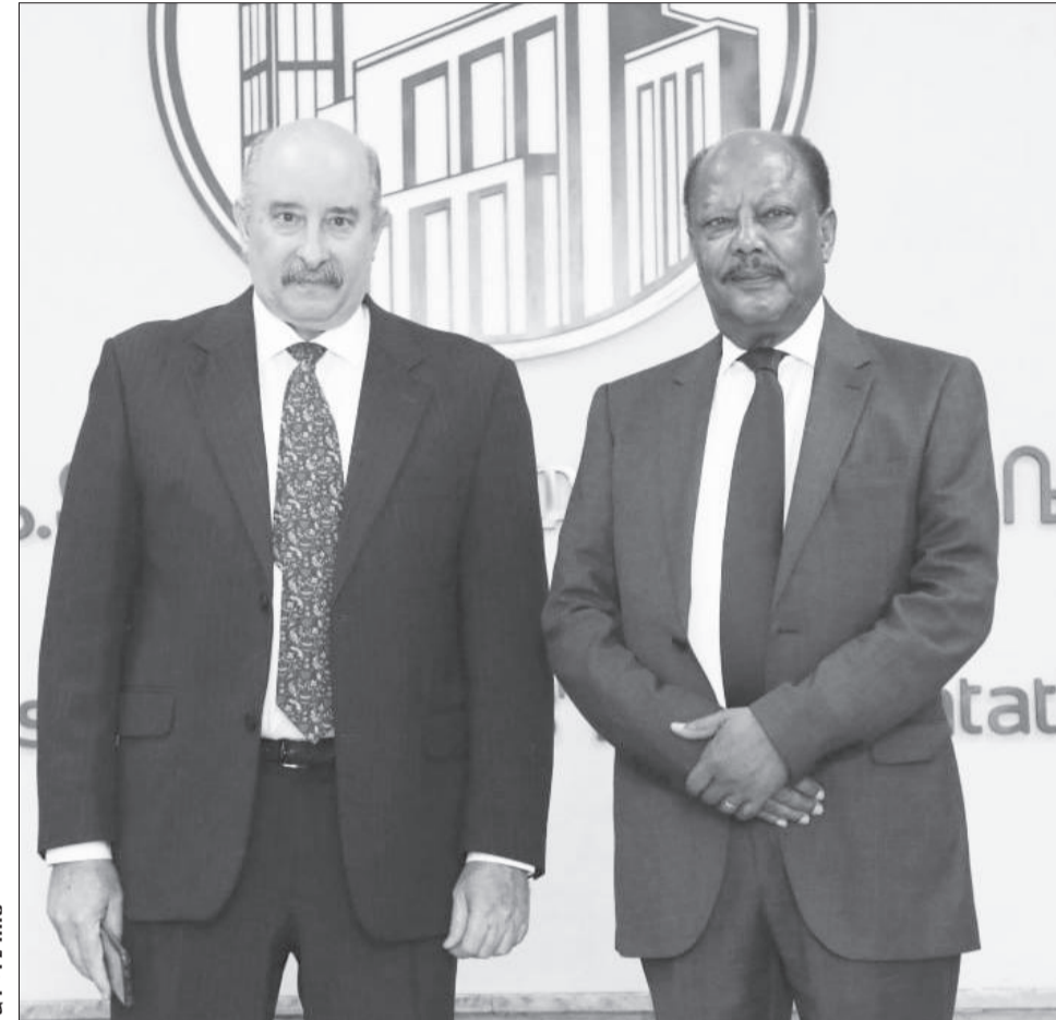
ፊት ላይ ከህጋዊ

ኩባ በኢትዮጵያ ያለውን የቡና ኢንዱስትሪ ለማሳደግና የሁለቱን አገራት የኢኮኖሚ ተጠቃሚነት ለማሳደግ በጋራ የሚስራት ፍላጎት አላት ብለዋል።